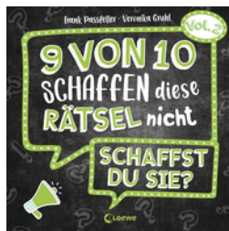
9 von 10 schaffen diese Rätsel nicht - schaffst du sie? - Vol. 2