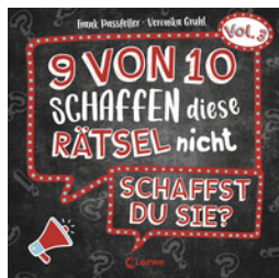
9 von 10 schaffen diese Rätsel nicht - schaffst du sie? - Vol. 3