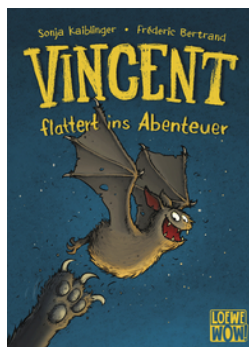
Vincent flattert ins Abenteuer (Band 1)