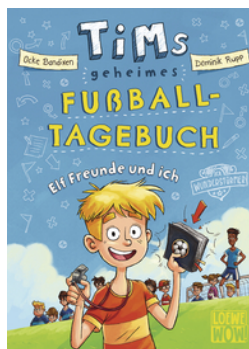
Tims geheimes Fußball- Tagebuch (Band 1) - Elf Freunde und ich!