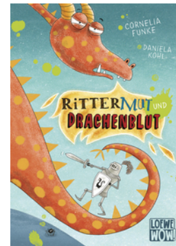
Rittermut und Drachenblut