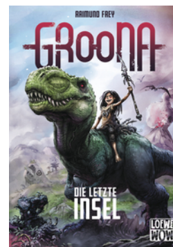
Groona - Die letzte Insel