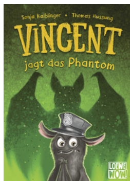
Vincent jagt das Phantom (Band 5)