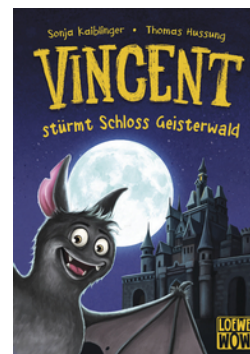
Vincent stürmt Schloss Geisterwald (Band 4)