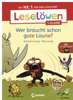
Leselöwen 1. Klasse - Jim ist mies drauf - Wer braucht schon gute Laune?