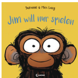
Jim will nur spielen