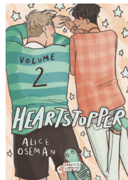
Heartstopper Volume 2 (deutsche Ausgabe)