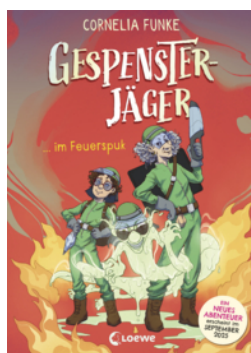
Gespensterjäger im Feuertopk (Band 2) - Mit 8 neu illustrierten Farbseiten