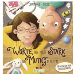
Worte, die mich stark und mutig machen