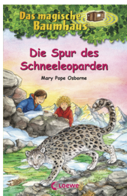
Das magische Baumhaus (Band 60) - Die Spur des Schneeleoparden