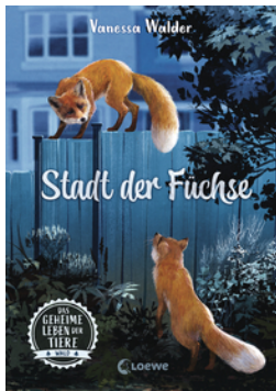
Das geheime Leben der Tiere (Wald) - Stadt der Füchse