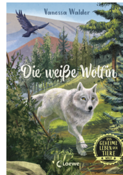
Das geheime Leben der Tiere (Wald) - Die weiße Wölfin