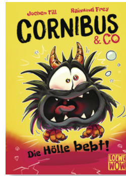
Cornibus & Co (Band 3) - Die Hölle bebt!