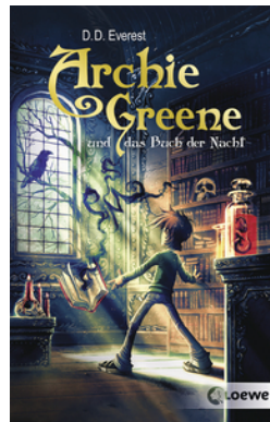
Archie Greene und das Buch der Nacht (Band 3)