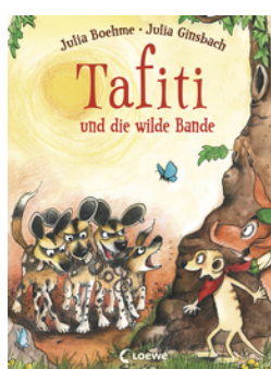
Tafiti und die wilde Bande (Band 20)