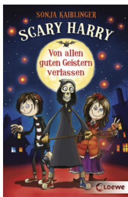
Scary Harry - Von allen guten Geistern verlassen