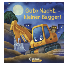
Gute Nacht, kleiner Bagger!