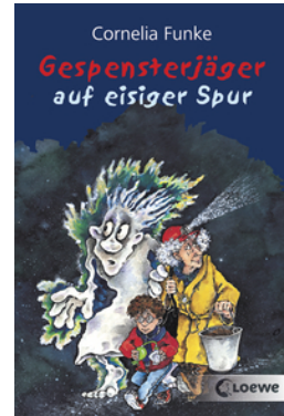
Gespensterjäger auf eisiger Spur