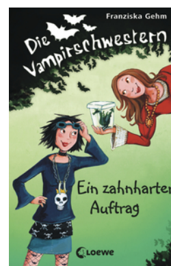
Die Vampirschwestern (Band 3) - Ein zahnharter Auftrag