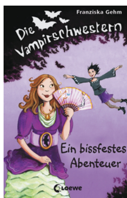
Die Vampirschwestern (Band 2) - Ein bissfestes Abenteuer