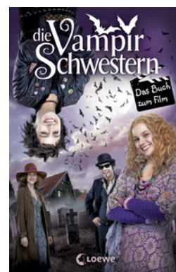
Die Vampirschwestern – Das Buch zum Film