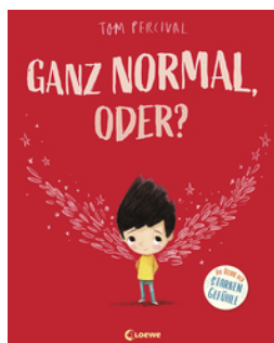
Ganz normal, oder? (Die Reihe der starken Gefühle)