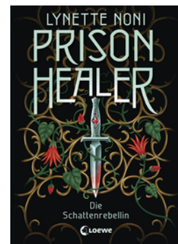
Prison Healer (Band 2) - Die Schattenrebellin