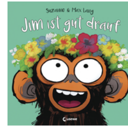
Jim ist gut drauf