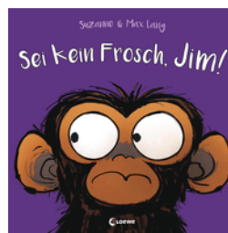
Sei kein Frosch, Jim!