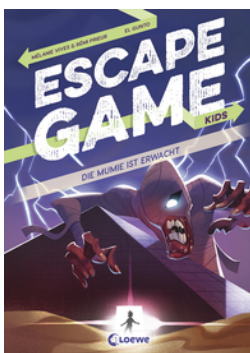
Escape Game Kids - Die Mumie ist erwacht