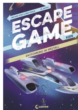
Escape Game Kids - Entführung im Weltall