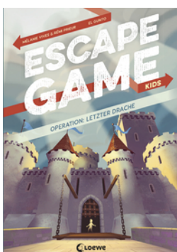
Escape Game Kids - Operation: Letzter Drache