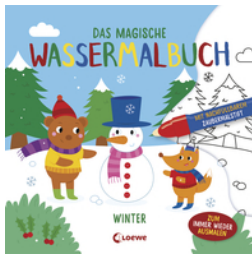
Das magische Wassermalbuch - Winter