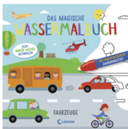
Das magische Wassermalbuch - Fahrzeuge