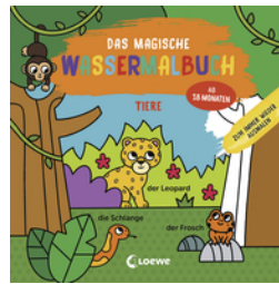
Das magische Wassermalbuch - Tiere