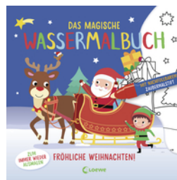
Das magische Wassermalbuch - Fröhliche Weihnachten!