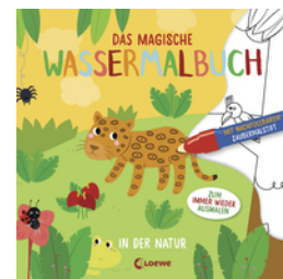
Das magische Wassermalbuch - In der Natur