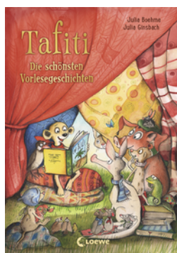
Tafiti - Die schönsten Vorlesegeschichten