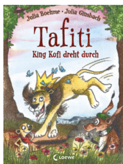
Tafiti - King Kofi dreht durch (Band 21)