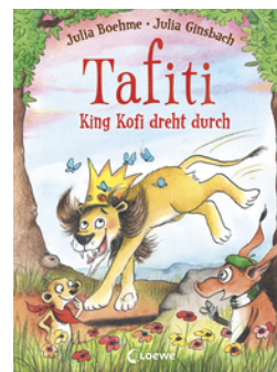
Tafiti - King Kofi dreht durch (Band 21)