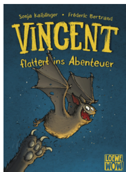
Vincent flattert ins Abenteuer (Band 1)