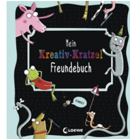
Mein Kreativ-Kratzel Freundschaftsbuch