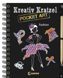
Kreativ-Kratzel Pocket Art: Fashion