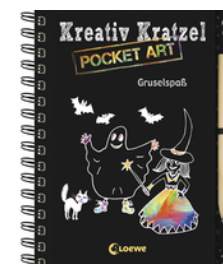
Kreativ-Kratzel Pocket Art: Gruselspaß