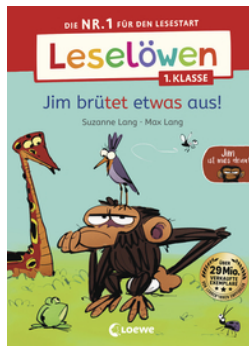
Leselöwen 1. Klasse - Jim ist mies drauf - Jim brütet etwas aus!