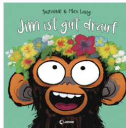
Jim ist gut drauf