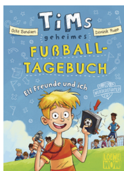
Tims geheimes Fuball- Tagebuch (Band 1) - Elf Freunde und ich!