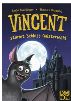
Vincent sturmt Schloss Geisterwald (Band 4)