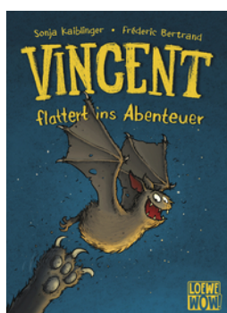
Vincent flattert ins Abenteuer (Band 1)