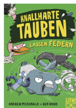
Knallharte Tauben lassen Federn (Band 2)