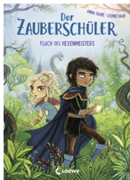
Der Zauberschüler (Band 1) - Fluch des Hexenmeisters