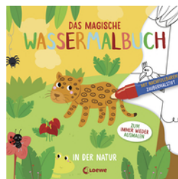
Das magische Wassermalbuch - In der Natur