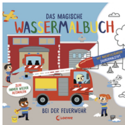
Das magische Wassermalbuch - Bei der Feuerwehr