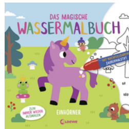
Das magische Wassermalbuch - Einhörner