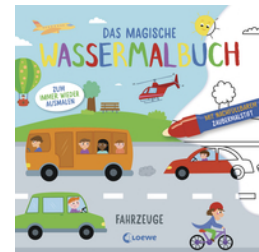
Das magische Wassermalbuch - Fahrzeuge