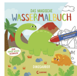
Das magische Wassermalbuch - Dinosaurier