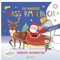
Das magische Wassermalbuch - Fröhliche Weihnachten!