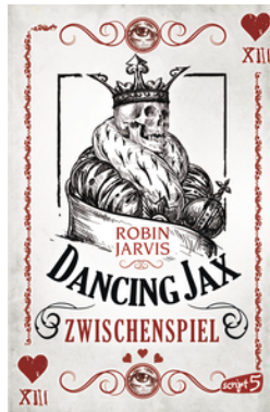
Dancing Jax – Zwischenspiel