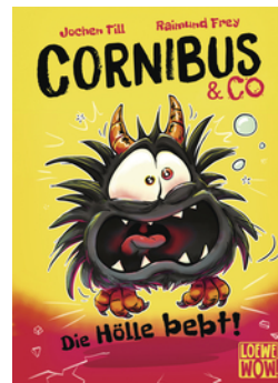
Cornibus & Co (Band 3) - Die Hölle bebt!