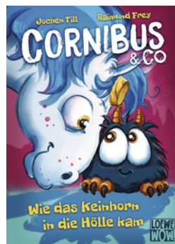
Cornibus & Co. (Band 4) - Wie das Keinhorn in die Hölle kam