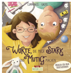
Worte, die mich stark und mutig machen