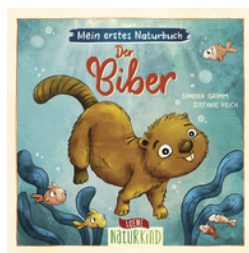
Mein erstes Naturbuch - Der Biber