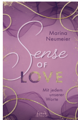
Sense of Love - Mit jedem unserer Worte (Love-Trilogie, Band 3)