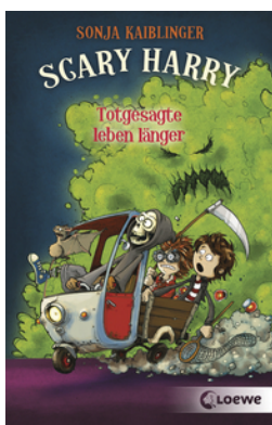
Scary Harry (Band 2) - Totgesagte leben länger