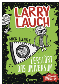
Larry Lauch zerstört das Universum (Band 2)