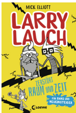
Larry Lauch zerstört Raum und Zeit