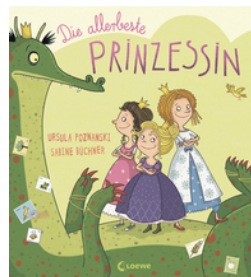
Die allerbeste Prinzessin