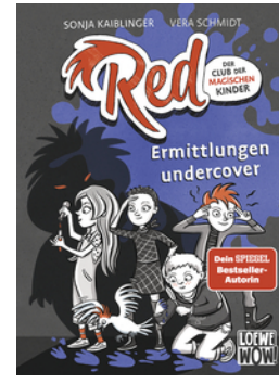
Red - Der Club der magischen Kinder (Band 2) - Ermittlungen undercover