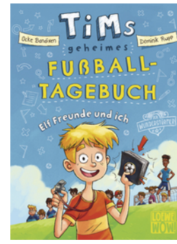
Tims geheimes Fußball-Tagebuch (Band 1) - Elf Freunde und ich!