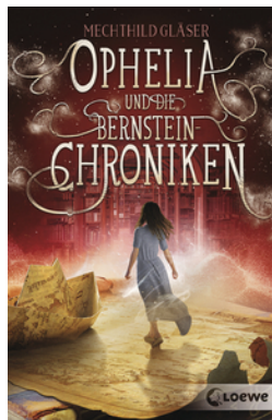
Ophelia und die Bernsteinchroniken