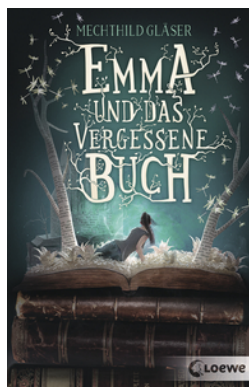
Emma und das vergessene Buch