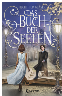
Das Buch der Seelen