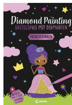
Diamond Painting - Bastelspaß mit Diamanten - Prinzessinnen