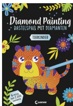
Diamond Painting - Bastelspaß mit Diamanten - Tierkinder