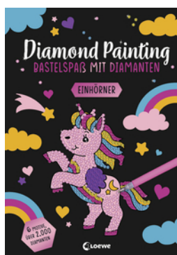
Diamond Painting - Bastelspaß mit Diamanten - Einhörner