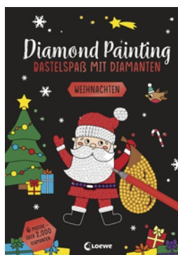
Diamond Painting - Bastelspaß mit Diamanten - Weihnachten