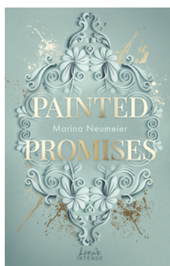
Painted Promises (Golden Hearts, Band 3)