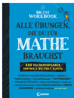
Big Fat Workbook - Alle Übungen, die du für Mathe brauchst