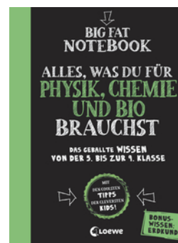
Big Fat Notebook - Alles, was du für Physik, Chemie und Bio brauchst - Das geballte Wissen von der 5. bis zur 9. Klasse. Mit Bonuswissen: Erdkunde