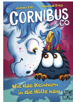
Cornibus & Co. (Band 4) - Wie das Keinhorn in die Hölle kam