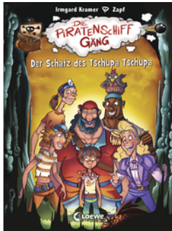
Die Piratenschiffgänger 4 - Der Schatz des Tschupa Tschupa