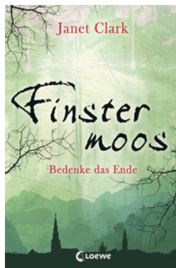
Finstermoos – Bedenke das Ende