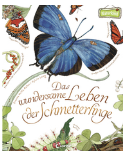
Das wundersame Leben der Schmetterlinge