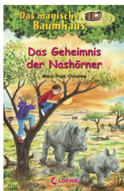
Das magische Baumhaus (Band 61) - Das Geheimnis der Nashörner