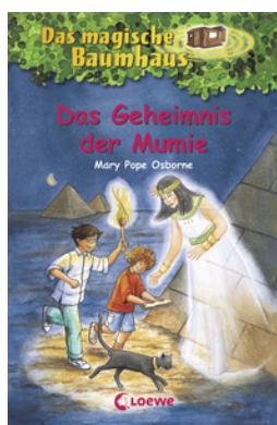
Das magische Baumhaus (Band 3) - Das Geheimnis der Mumie