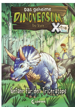
Das geheime Dinoversum Xtra (Band 2) - Gefahr für den Triceratops