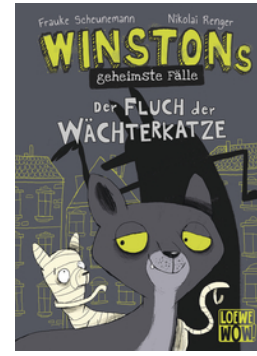
Winstons geheimste Fälle (Band 1) - Der Fluch der Wächterkatze