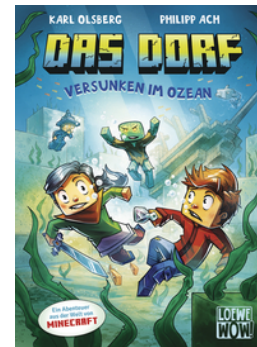
Das Dorf (Band 5) - Versunken im Ozean