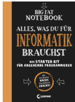
Big Fat Notebook - Alles, was du für Informatik brauchst - Das Starterkit für angehende Programmierer