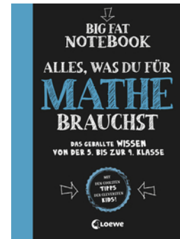
Big Fat Notebook - Alles, was du für Mathe brauchst - Das geballte Wissen von der 5. bis zur 9. Klasse