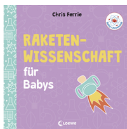
Baby-Universität - Raketenwissenschaft für Babys